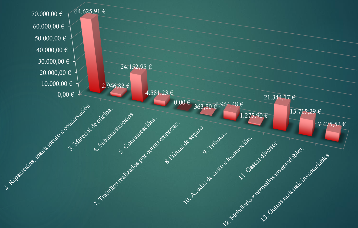
Gráfico de distribución do Gasto